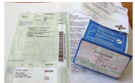
Obrázok 1: Owing bag, owing bag label and pharmacy owing docket

V Británii je až na pár výnimiek možné otvoriť balenie lieku a vydať presne predpísaný počet kapsúl, tablet alebo odmerať presne predpísaný objem roztoku, či sirupu. Aj z tohto dôvodu je možné, že lekárne pacientovi dlží presný počet tablet, kapsúl, prípadne presný objem roztoku, či sirupu. Po dodaní chýbajúcej položky dodávateľom lekární vydispenzuje „owing“ liek (používa sa výraz – „to redeem an owing“) a na štítok dispenzovanej tašky s adresou a menom pacienta – „dispensing bag label“ napíše číslo „owing“ lístka, zároveň k taške pripojí aj pôvodný ústrižok lekární – „owing docket“. Pacient sa vráti pre „owing“ do lekární, preukáže sa ústrižkom pacienta, a tým je „owing completed“ alebo je „owing“ doručený pacientovi priamo domov – „delivery“.