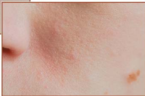
Krycí efekt po aplikování Aknecolor krémpasty