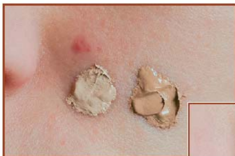
Aplikace barevné tónované krémpasty Aknecolor light + Aknecolor

Léčba akné má být zahájena v okamžiku výskytu prvních uhříků – jediné tak můžeme zabránit rozvoji těžších forem a případnému jizvení. Hlavní zásadou je vysvětlit pacientovi chronickou podstatu onemocnění a nutnost pravidelného a pečlivého čištění pleti. Lze zdůraznit, že manipulace jako mačkání, škrábání apod. jsou nevhodné a mohou projevy akné