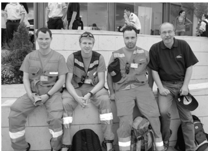
S kolegy z jesenické záchranky